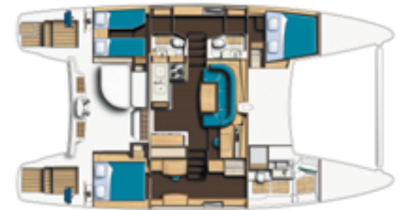
propriétaire / owner

Another key benefit of the Catana 47 is the generous headroom under the nacelle, making it comfortable at high speeds, even in heavy seas. This contributes to the boat's unique static and dynamic stability, making it easy for the helmsman to control the sails even in high winds. Its legendary ease of use in all weathers is combined with straightforward maintenance and simple resale, for complete peace of mind.